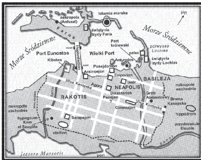
Rys. 1. Plan miasta Aleksandrii